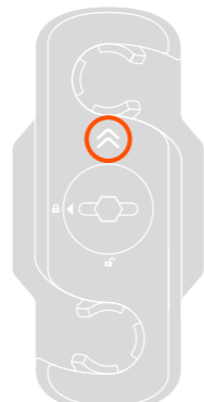
B | connector