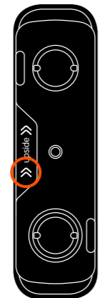
A | base