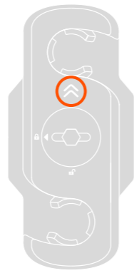
B | connector